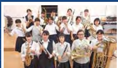
昭島市立昭和中学校吹奏楽部